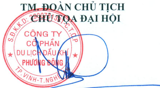
Thái Hồng Nhã

Đại hội biểu quyết thông qua Biên bản, Nghị quyết Đại hội đồng cổ đông thường niên năm 2023 với 100% số phiếu tán thành. Đại hội kết thúc vào hồi 11h10' ngày 26/04/2023./.